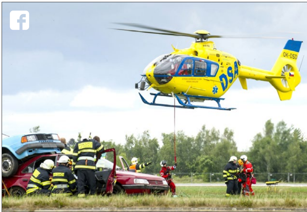
Atraktivní součástí programu Helicopter Show je zásah všech složek integrovaného záchranného systému společně s vrtulníky u simulované hromadné nehody, diváci se na něj mohou těšit i letos.

Hlavní programy obou akcí budou na sebe navazovat. Diváci si užijí na jeden vstup bohatý program ve vzduchu i na zemi, včetně zážitkových jízd a letů na vlastní kůži. Parkování na letišti bude zdarma. Více na webech www.helicoptershow.cz a www.rallyshow.cz . (red)