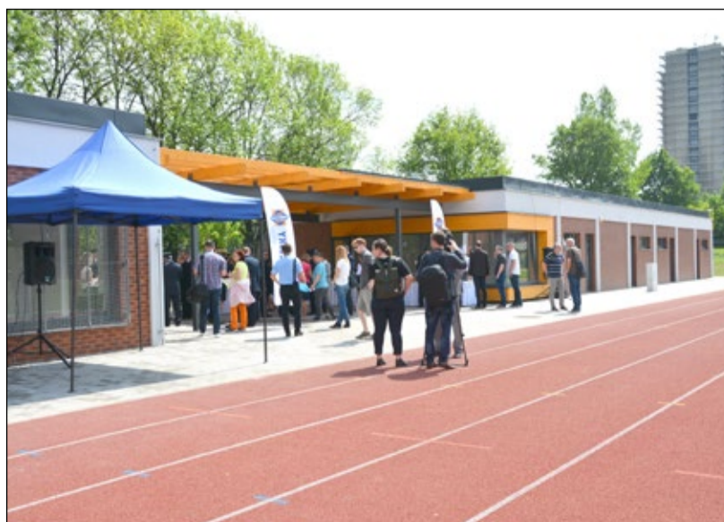
Výstavba zázemí hasičského stadionu se šatnami, sprchami, toaletami, sklady a podobně přišla na 17,6 milionu korun.

Druhá etapa přestavby stadionu pro výcvik hasičů a požární sport mezi ulicemi Brněnská, Botanická a 17. listopadu je u konce. V areálu vyrostly dva propojené objekty, v nichž mají uživatelé k dispozici nové šatny a sociální zařízení, zázemí zde mají i rozhodčí a zdravotníci. V severní kruhové výšce stadionu navíc vzniklo hřiště pro tenis, badminton a volejbal. Náklady na II. etapu rekonstrukce stadionu činily 17,6 milionu korun, přičemž na financování se kromě státu a kraje podílelo i město Hradec Králové. Dříve zanedbaný prostor se postupně mění od léta roku 2015, kdy zde do května následujícího roku vyrostla čtyřvěž s rozběhovou dráhou a atletický ovál s šesti i osmi dráhami. Stadion bude sloužit nejen profesionálním a dobrovolným hasičům, ale také sportovcům, školám a dalším. (čer)