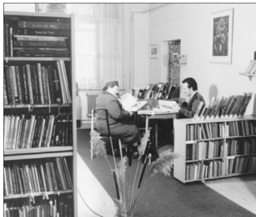
Tak to vypadalo v oddělení pro dospělé v kuklenské knihovně sídlící v domě čp. 88 v roce 1970.