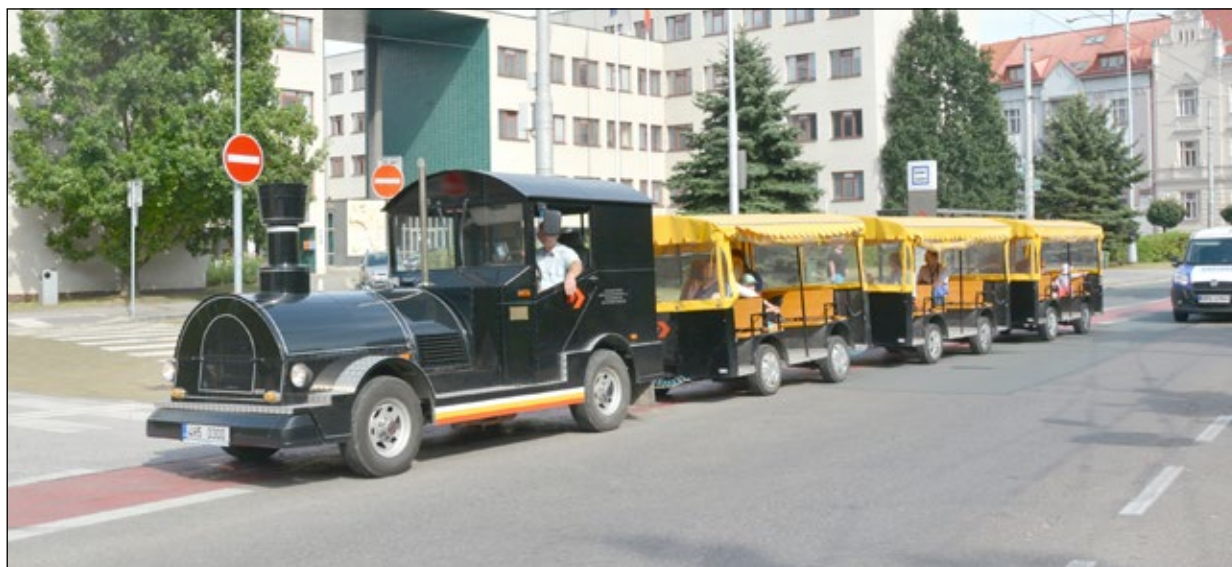
Turistický vláček na trasu vyjíždí tradičně z parkoviště u muzea na Eliščině nábřeží.

V případě zrušení jízd kvůli počasí nebo z technických důvodů najdou cestující oznámení do 10 hodin na označnicku u Muzea východních Čech a na stránkách www.dpmhk.cz . Aktuální jízdní řád, mapky a další informace jsou na http://vlacek.dpmhk.cz/ . (red)