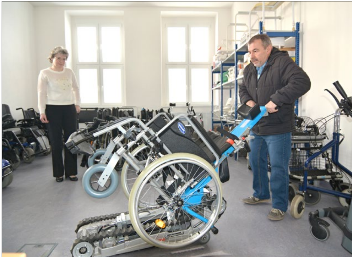
Centrum pro integraci osob se zdravotním postižením Královéhradeckého kraje, které sídlí v ulici Jana Černého ve Věkoších, zájemcům vloni půjčilo 559 rehabilitačních a kompenzačních pomůcek.

bariér, mohou zprostředkovat kontakt s dodavatelem zdravotnických prostředků, nebo s jinými půjčovnami. Zájemci o konkrétní typ pomůcky získají veškeré informace na telefonním čísle 495 538 867 nebo na e-mailové adrese: hradeckralove@czphk.cz. Další informace najdete na webu www.czphk.cz. Kromě půjčovny v Hradci je možné získat pomůcky i v pobočkách v Jičíně, Náchodě, Rychnově nad Kněžnou a Trutnově. (pp)