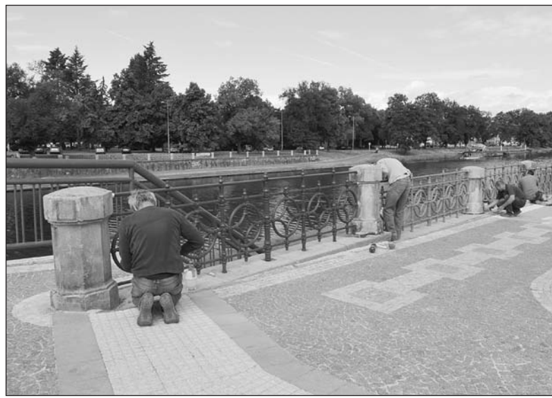
Většina prací na obnově litinového zábradlí na labském nábřeží byla provedena už v minulých letech.

Předmětem obnovy poslední části litinového zábradlí bude, stejně jako u předchozích úseků, nejen samotné zábradlí, ale také pískovcové sloupky. Zhotovitel prací je vázán návrhem obnovy zábradlí zpracovaného diplomovaným technikem v květnu roku