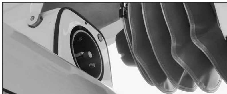
Mezi elektrobuses a rychlonabíjecím stanice probíhá komunikace pomocí wi-fi, k napojení na stanice slouží speciální střešní zásuvka.

Systém automatického nabíjecího stanice využívá nejnovější technologii, které je podmínkou pro ostrý provoz. Projekt je plně hrazen z prostředků společnosti SOR Libchavy a jeho cílem je ve spolupráci s dopravním podnikem ověřit užitné vlastnosti nabíjecího stanice v reálných podmínkách. Díky průběžnému rychlonabíjení teď může dopravní podnik nasadit elektrobuses SOR EBN 11 na linku s denním nájezdem zhruba 250 kilometrů.