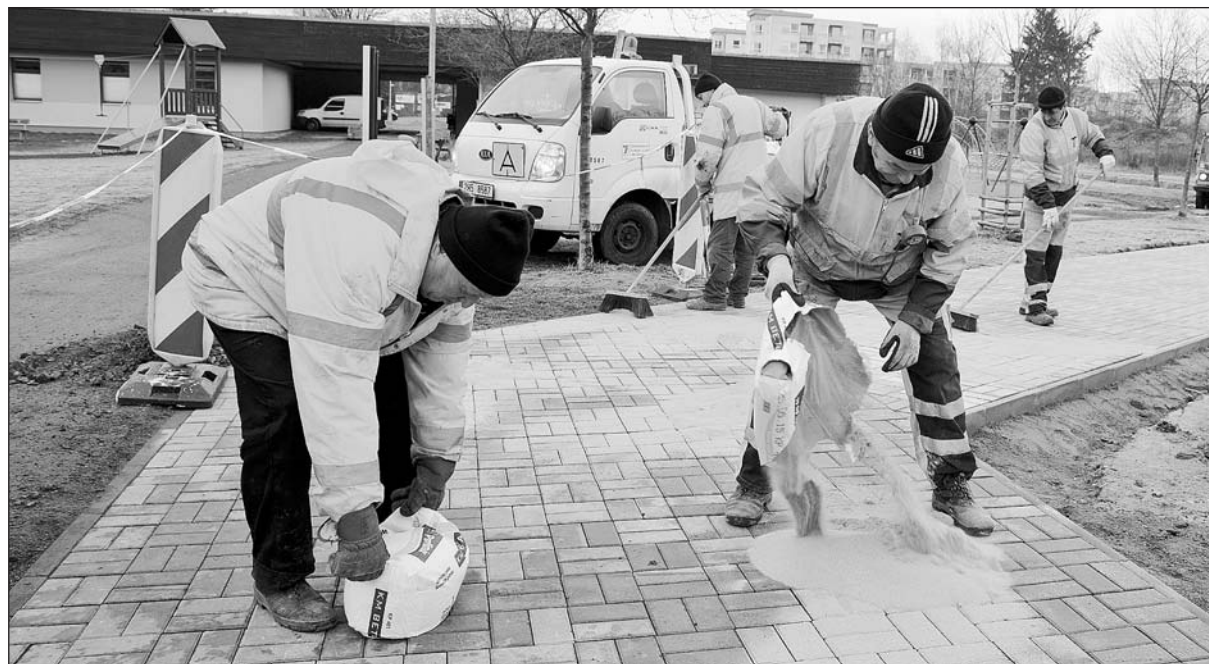
Technické služby se pustily do obnovy povrchů cest v prostoru mlhoviště v Čajkovského ulici v Malšovicích, čímž vyslyšely požadavek tamější komise místní samosprávy. Poničené cesty zčásti pokryje nová dlažba, jinde pracovníci položí živičný povrch, počítá se i s výměnou laviček. Všechny práce by měly být hotovy do poloviny dubna.