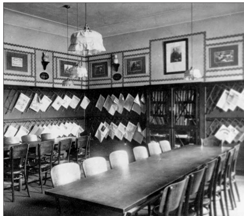
Palackého čítárna měla v době otevření k dispozici okolo stovky novin a časopisů a byla otevřena ve všední dny a v neděli dvakrát denně. V zimě, kdy se v místnosti vystřídal denně až sedmdesát lidí a pro kouř z kamen nebylo moc vidět, zde byl pobyt ne zcela příjemný.