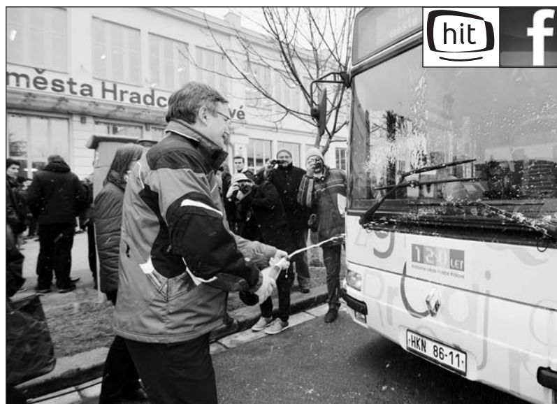
Křest autobusu, výstava fotografií z historie a současnosti knihovny, vydání symbolické pamětní jízdenky, hudební vystoupení a další program - to vše provázelo 1. března připomínku letošních 120 let od otevření první královéhradecké knihovny.

Významným momentem v životě knihovny bylo vytvoření takzvaného Velkého Hradce v roce 1942, kdy byly k městu připojeny okolní obce. Jejich samostatné knihovny se staly pobočkami Městské veřejné knihovny v Hradci Králové a střípky z této části historie přineseme v dalším vydání Radnice. (pp)